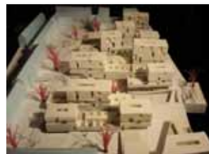
Modell Wohnbauteil – Wettbewerb | transparadiso, 2007