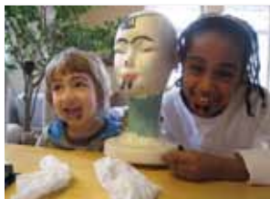
Viel Platz für Kinder