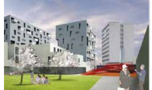
Schaubild Korridor | transparadiso © 2009

Alle Wohnungen profitieren vom begleitenden EU-Programm Concerto: Einsatz von Photovoltaik und weiteren Energiesparmaßnahmen