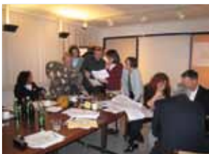
Beispiel Wohngruppenbesprechung