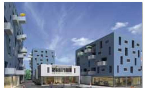
Am Boulevard – Blick nach Norden | Bernd Vlay © 2009